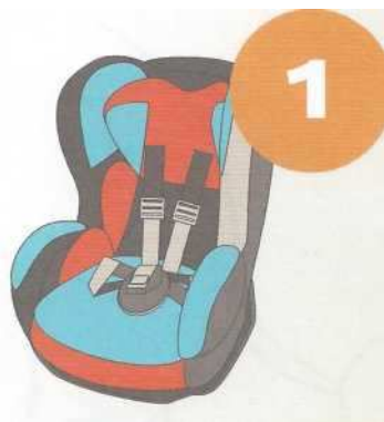
9-18 кг от 9 месяцев до 4 лет