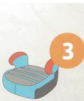
22-36 кг от 6 до 12 лет